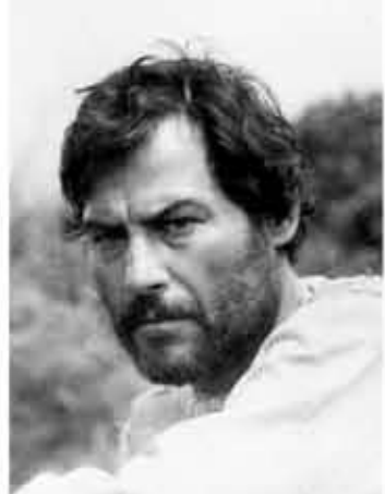
'A Hora e a Vez de Augusto Matraga': trilha de Vandré

porém, muito mais. Muito além, portanto, da cristalização desse mesmo mito. Enxerguei Geraldo Pedrosa de Araújo Dias, homem extremamente lúcido e pé no chão, pronto a falar duras e cristalinas verdades de modo refinado e elegante, dado o aguçado senso crítico que impressiona profundamente quem se coloca na condição de seu interlocutor.